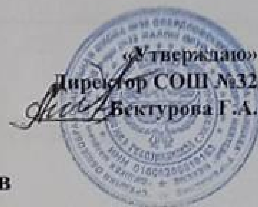
График посещения уроков на 2018-2019 учебный год